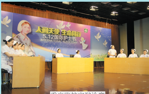
重症监护室辩论赛