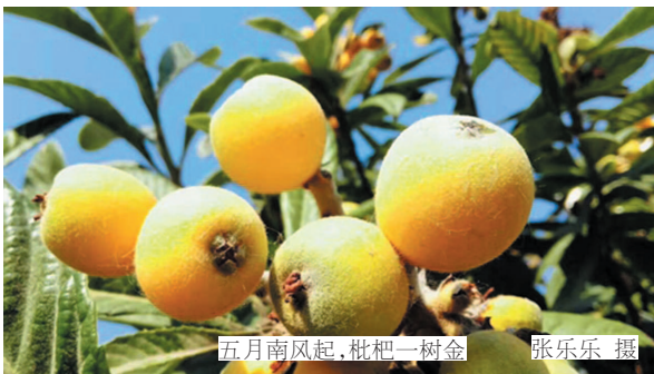
五月南风起，枇杷一树金