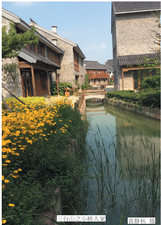
三台山之小桥人家