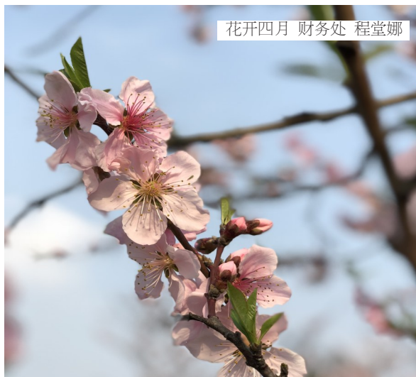
花开四月 财务处 程堂娜