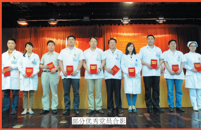
部分优秀党员合影